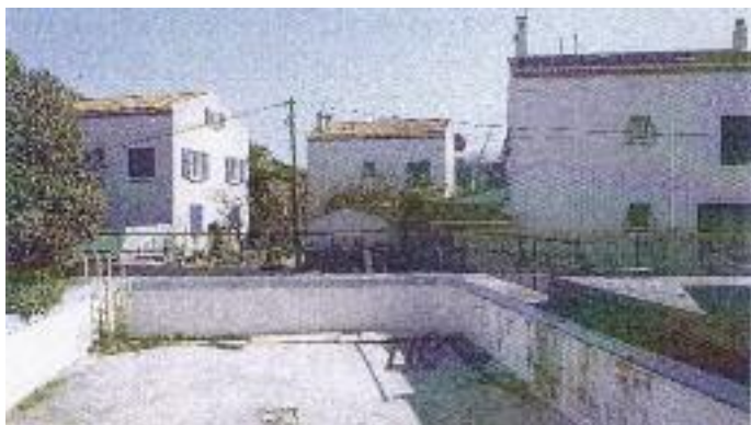
Piscine de l'école publique lundi 6 mars 2006, il reste le bassin vide...

La deuxième photo montre la même installation vide car la piscine n'est plus en service depuis de nombreuses années (un lecteur pourrait-il nous préciser depuis quand ?). On ne la voit pas, actuellement, car elle se situe derrière les maisons à côté de l'Ecole où étaient logés les enseignants. Ces maisons sont inoccupées également depuis plusieurs années et nous avons proposé à la Mairie de les affecter pour une partie au secteur associatif et pour l'autre partie d'en faire un parking de voitures , ce qui pourrait améliorer les problèmes de stationnement souvent évoqués dans ce journal.