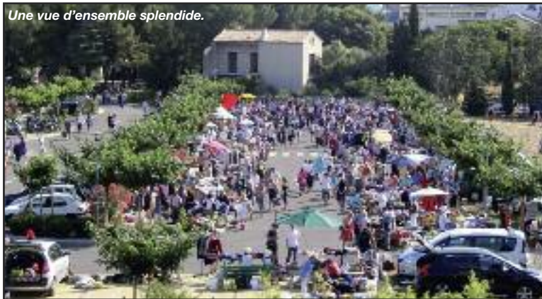
Une vue d'ensemble splendide.