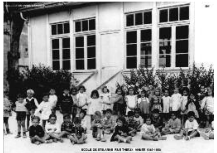
Photo de classe

Lecteurs aidez-nous en nous donnant des précisions et des noms !