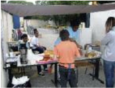
Une preuve de la bonne organisation : la tenue de la buvette par les élèves.

Grande réussite de ce vide grenier. Félicitations aux élèves. Plus de 150 participants. Le temps était au beau. Les bénéfices de cette manifestation permettent aux classes terminales d'effectuer un voyage d'études en Angleterre.