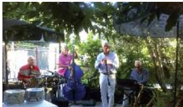
Les quatre supers musiciens de l'Orchestre Hot Peppers

Hot Peppers que nous connaissons bien et qui nous enchantent au sens propre et au sens figuré avec leurs rythmes de jazz New Orleans. Cette fois-ci encore la magie a opéré, ce qui a permis à tous les convives