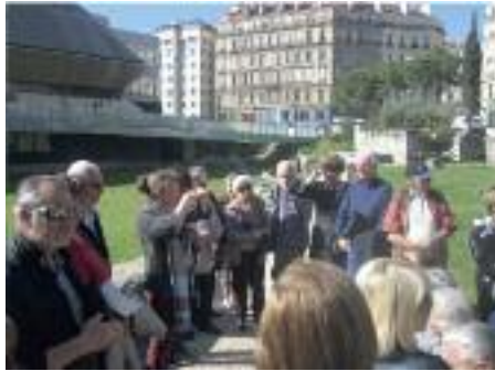
Le Groupe du C.I.Q. dans les jardins des vestiges

A l'intérieur, des épaves de navires Grecs et Romains symbolisent le destin maritime de la ville. Et au fur et à mesure que nous avançons dans le musée, nous progressons dans le temps. Ici un chapiteau Ionique rappelle que trois temples dédiés à Athéna, Apollon et Artémis avaient été érigés par les Grecs, là qu'au 5 ème et 6 ème siècle une abbaye funéraire fut construite rue Malaval, où une trentaine de sarcophages ont été retrouvés. Et ainsi, de maquettes en statues, d'objets d'époque en outils, de tableaux en supports multimédia, nous voyageons dans l'histoire remarquable et mouvementée de notre ville. Au total 4.000 objets sont exposés ce qui montre la richesse de notre patrimoine culturel.